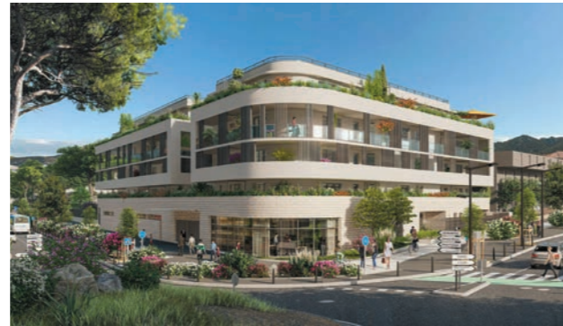
LA PORTE DES CALANQUES MARSEILLE 9 E

40 ANS DE SAVOIR-FAIRE dans l'immobilier en région PACA