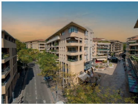
LE MIRABEAU AIX-EN-PROVENCE

Depuis plus de 40 ans, Progereal se distingue par sa capacité à faire émerger des projets innovants et audacieux en région PACA, dans le secteur du logement comme dans le tertiaire et l'activité commerciale. Progereal allie la réactivité d'une entreprise à taille humaine et la compétence d'un groupe structuré et peut compter sur un partenariat bancaire de premier rang, sur sa connaissance parfaite du marché et de ses acteurs en région PACA.