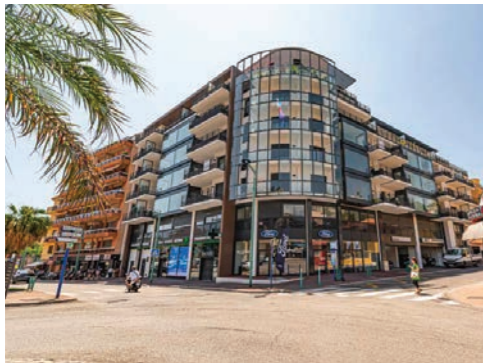
CAP RIVIERA MENTON