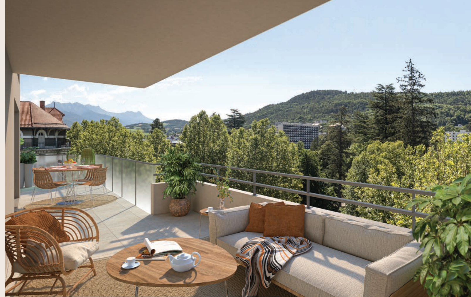
FACE À LA COLLINE SAINT MENS, DONT LE SOMMET CULMINE À 970 MÈTRES