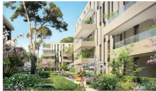
ADN MARSEILLE 8 E