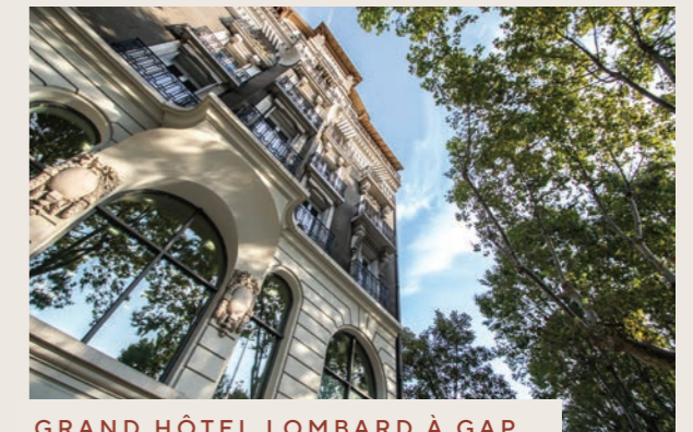
GRAND HÔTEL LOMBARDE À GAP

Désignée "ville la plus sportive de France" par le magazine l'Equipe, Gap est enfin le point de ralliement de tous les amateurs de nature et de sport alpin, avec le parc national des Ecrins à seulement quelques minutes en voiture, et pas moins de sept stations de ski situées à moins de 40 kilomètres. Été comme hiver, il y a toujours quelque chose à faire à Gap!