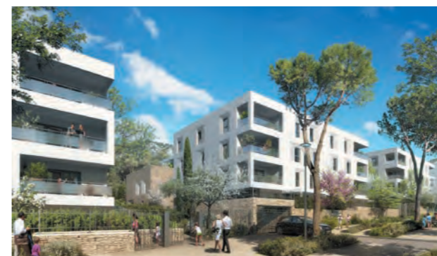
LES HAUTS DE SORMIOU MARSEILLE 9 ÈME

L'activité du Groupe s'exerce exclusivement en Provence Côte d'Azur. Volonté correspondant à un objectif, celui d'une parfaite connaissance des marchés et des intervenants.