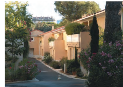
JARDIN D'EDEN MARSEILLE 9 ÈME

Promoteur de référence sur la région PACA