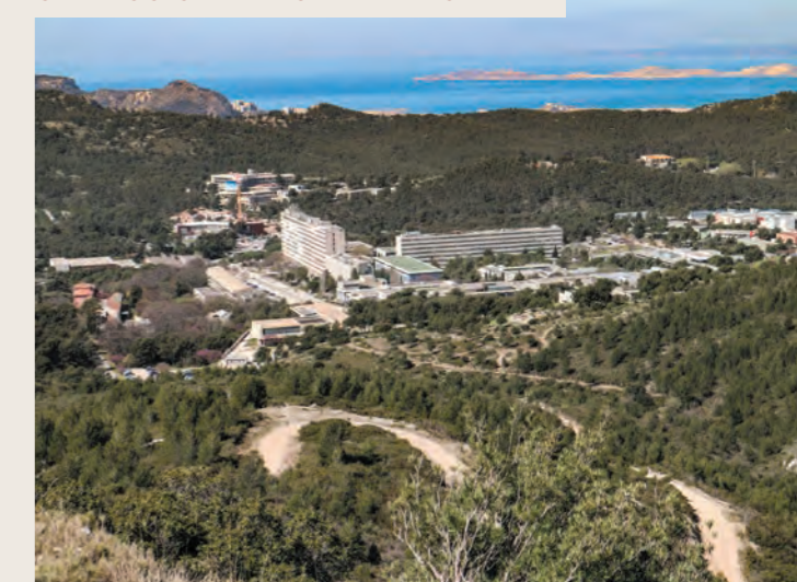
CAMPUS UNIVERSITÉ DE LUMINY

Le quartier du Redon accueille également l'un des plus grands pôles universitaires du sud de la France. On y retrouve notamment la Faculté de Sciences de Luminy, l'École Supérieure d'Architecture, l'École Supérieure des Beaux Arts et l'École de commerce Kedge.