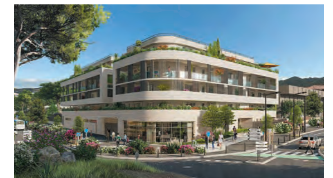
LA PORTE DES CALANQUES MARSEILLE 9 ÈME